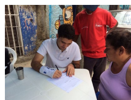
Jornada en Barrio La Ceiba